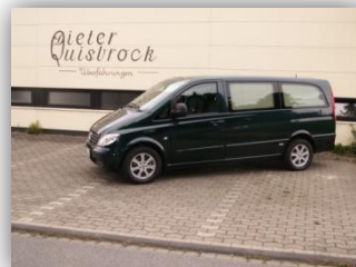
Mercedes Benz Vito Baujahr 2006