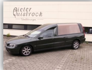
Volvo V70 Baujahr 2004