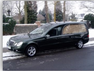
Mercedes Benz E-Klasse Baujahr 2009