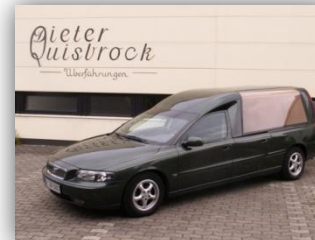
Volvo V 70 Baujahr 2002