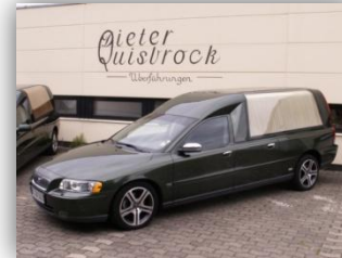
Volvo V 70 Baujahr 2006