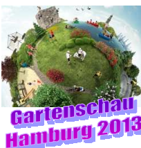
Gartenschau Hamburg 2013