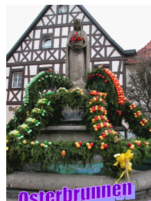
Osterbrunnen Fränkische Schweiz