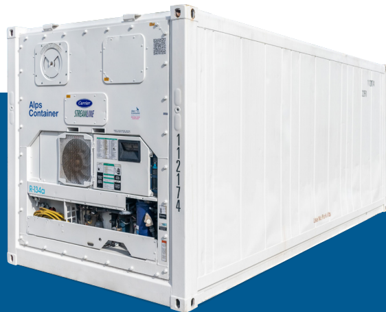
Aggregat von einem 20ft Kühlcontainer