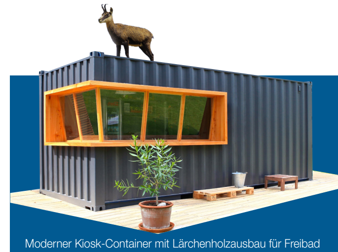
Moderner Kiosk-Container mit Lärchenholzausbau für Freibad