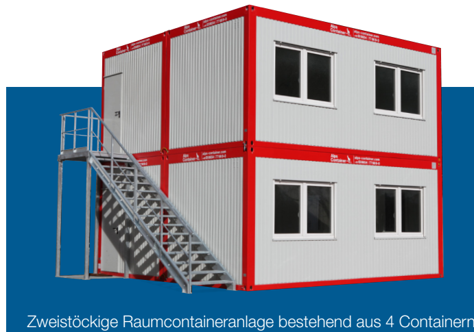
Zweistöckige Raumcontaineranlage bestehend aus 4 Containern