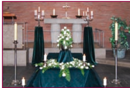
Kapelle Neuer Friedhof Harburg

Wir richten Ihre Trauerfeier ganz individuell nach Ihren Wünschen aus, am Ort Ihrer Wahl. Dabei können wir auf einen reichen Erfahrungsschatz zurückgreifen, der uns hilft, Ihre Vorstellungen genau umzusetzen.