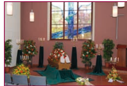
Friedhofskapelle Neu Wulmstorf