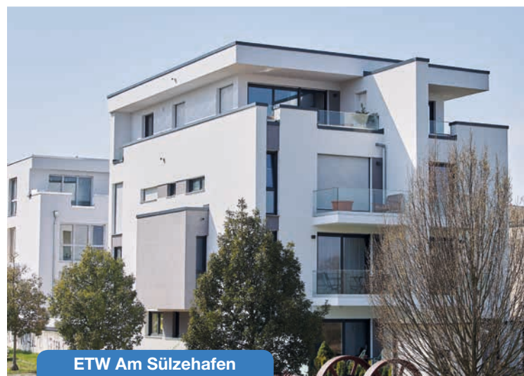
ETW Am Sülzehafen

Nicht nur auf dem Gebiet der Hausverwaltung sind wir ein vertrauensvoller Partner, auch wenn Sie eine Immobilie im Raum Magdeburg, Sachsen-Anhalt oder überregional erwerben, verkaufen oder vermieten wollen, können Sie sich an uns wenden und eine fachkundige Betreuung erfahren.