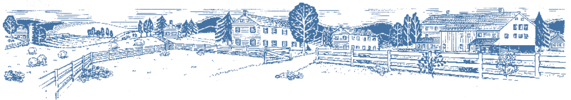
Illustrationen (Aquarell, Buntstifte / Bleistift, Edding)

A handwritten signature in blue ink, located in the bottom right corner of the page. The signature is stylized and appears to be the initials 'E.A.' followed by a flourish.