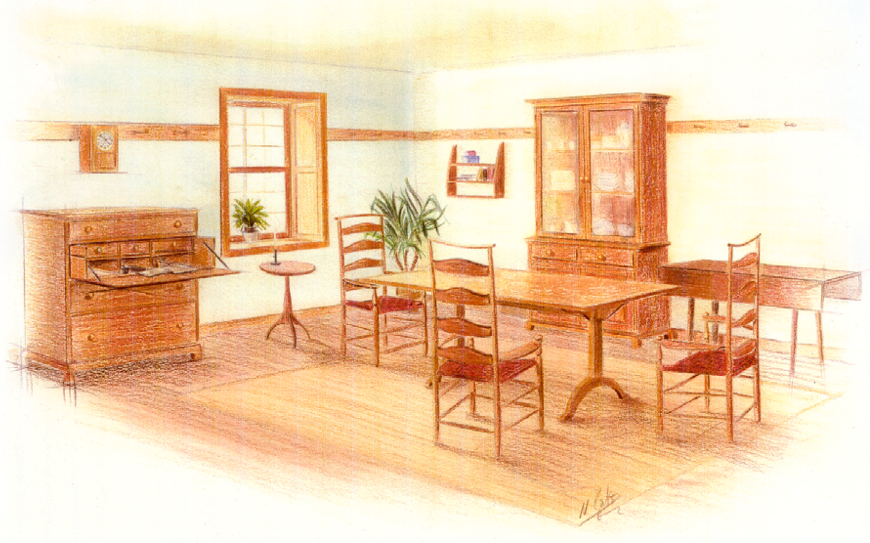
Illustration (Pastellkreide, Buntstifte)