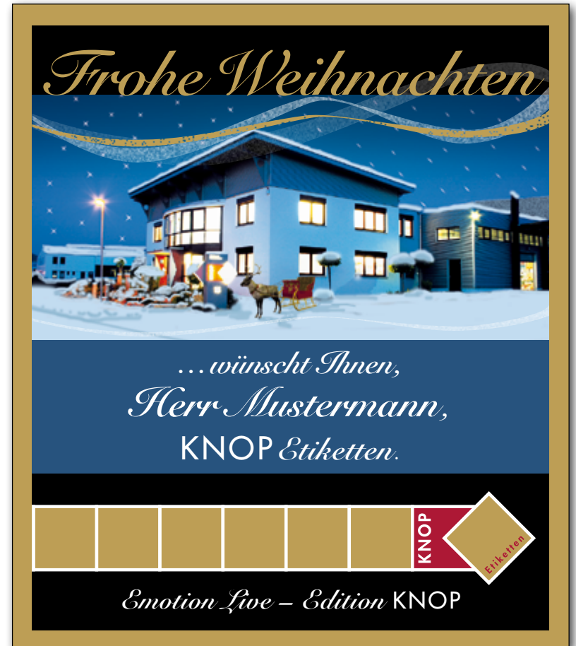
Bildbearbeitung und Gestaltung eines Weihnachts-Etiketts

A handwritten signature in blue ink, located in the bottom right corner of the page.