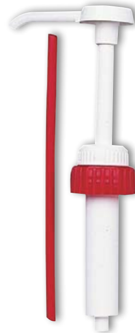
Dosierpumpe für 10 l Kanister Hub 20-25 ml