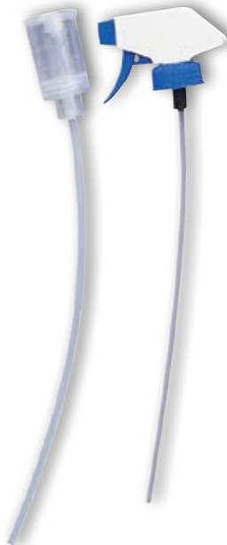
TOPDOS Dosieraufsatz 20 ml für 1 l Rundflasche