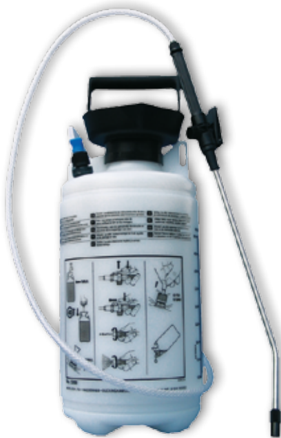
Drucksprühsystem 5 l Inhalt